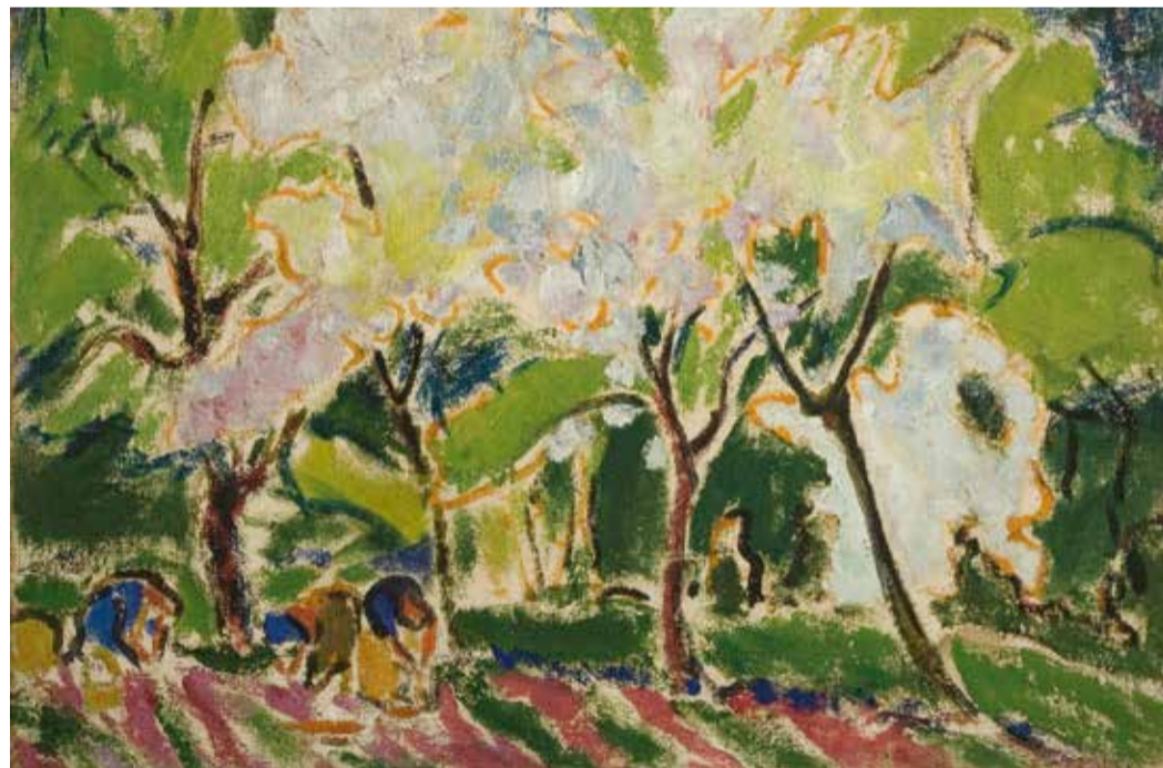
Ernst Ludwig Kirchner, Frühlingslandschaft, 1909, © und Foto: mpk

Ernst Ludwig Kirchner, ein großartiger Vertreter der Klassischen Moderne und unserer Sammlung